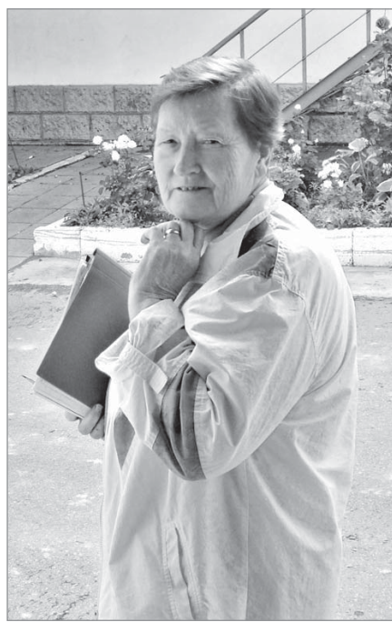
Портрет - экспромт. Вторник, 23 июля. 16.25. Через несколько минут – начало ежедневной планерки...